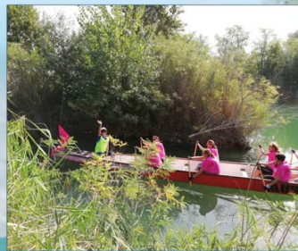
(Allegato 5: Dragonboat)